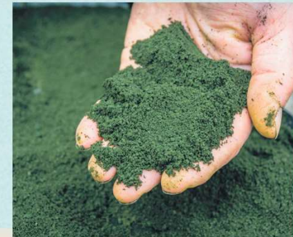
PROTEIN-KONCENTRAT svine- og hønefoder